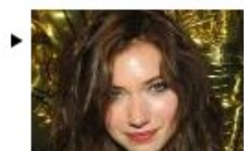
Interview vanity : Imogen Poots