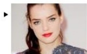
Interview vanity : Roxane Mesquida