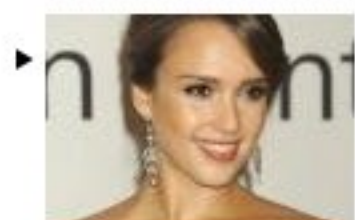
Interview vanity : Jessica Alba