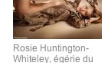
Rosie Huntington-Whiteley, égérie du parfum "Burberry Body"