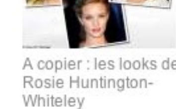
A copier : les looks de Rosie Huntington-Whiteley